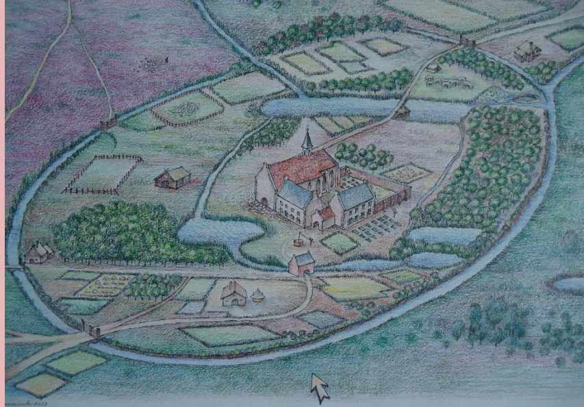
Een tekening van het klooster Nazareth. Het lag veilig tussen grachten en vijvers.

Zij sloegen de kloosterpoort aan stukken, smeten deuren open, trokken kasten omver en bedreigden de kloosterlingen. Die gaven af wat zij hadden. De soldaten schreeuwden dat zij terug zouden komen. Wat zij gekregen hadden (beter gezegd geroofd), was niet genoeg. Zij wisten niet dat in de grond bij klooster goud en zilver verstopt waren. Wat hadden de kloosterlingen gedaan?