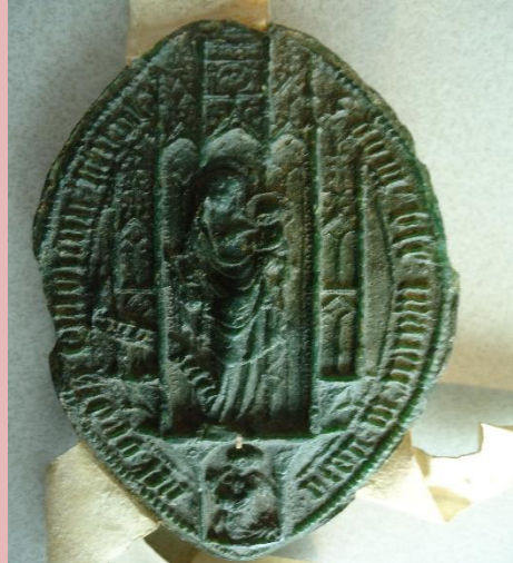
Het zegel van het klooster