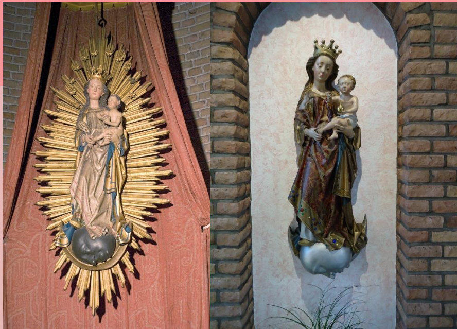
De twee Mariabeelden: nu in Anholt (links) en in Silvolde (rechts)

De preekstoel en de mooiste kerkbank werden naar buiten gesleept. Potten en pannen uit de keuken werden ook naar buiten gedragen. Een paard en wagen stond klaar en alles ging naar het kasteel van Bredevoort. Achter de dikke muren zouden de spullen in deze barre tijden veilig zijn.